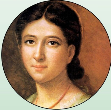
Venerable Paulina María Jaricot (1799-1862) Fundadora de la Obra "Propagación de la Fe"